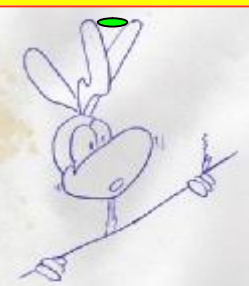
Rys. Piotr Dziugiel

A może chcielibyście już dziś wiedzieć, jaki będzie dzień tygodnia, gdy będziecie obchodzić 18-te urodziny ?