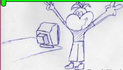
Rys. Tomek Warski

„W Nowym Roku chciałabym skończyć Gimnazjum, zdać pozytywnie egzaminy i pójść do szkoły zawodowej. Nie zamierzam pójść do Liceum, bo będzie matura z matmy, a ja tego nie zniosę.