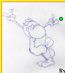
Rys. Piotr Dziugiel