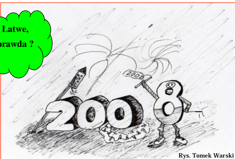
Rys. Tomek Warski